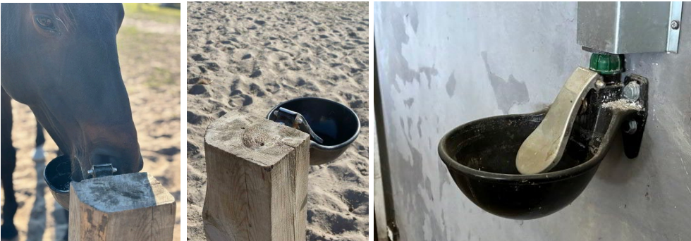
B07a + B07b + B07c

Pferdetränke: Ein Stoß mit dem Maul gegen die Platte (oben) öffnet ein Ventil, sodass Frischwasser in die Schale strömt. So bleiben keine großen Wassermengen lange in der Schale stehen.