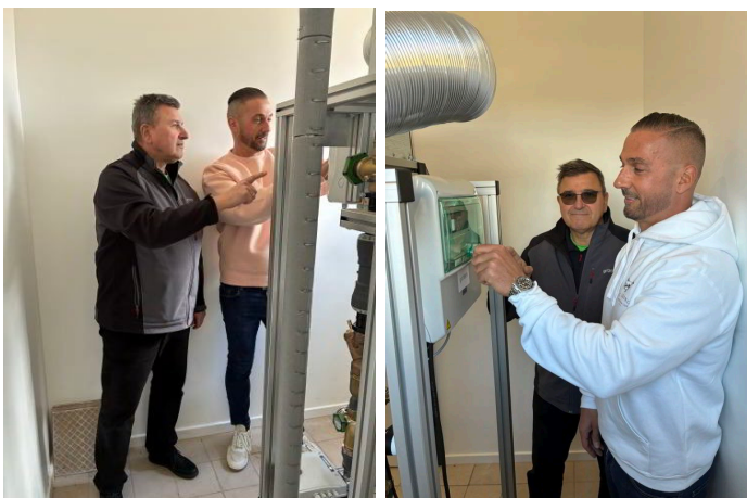
B06a + B06b

Großzügige Anlage: Neben dem 4.000 Quadratmeter großen Reitplatz verfügt der St. Georg Equestrian Club unter anderen über eine große, helle Reithalle.