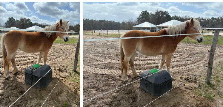
B08a + B08b

Pferdetränke: Ein Stoß mit dem Maul gegen die Platte (oben) öffnet ein Ventil, sodass Frischwasser in die Schale strömt. So bleiben keine großen Wassermengen lange in der Schale stehen.